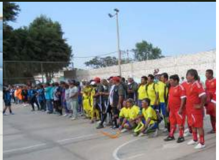
Inauguración de la Copa Cañera 2016