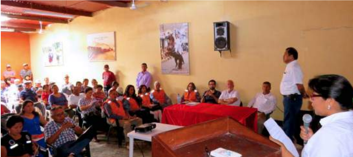
La cita se desarrolló en el auditorio de la Municipalidad Distrital de Cayaltí.

E l taller informativo de evaluación ambiental preliminar realizado el 19 de octubre del 2016 dejó importantes conclusiones. Los ciudadanos de Cayaltí que asistieron a la cita, convocada públicamente, respaldaron por unanimidad la construcción de la nueva planta industrial.