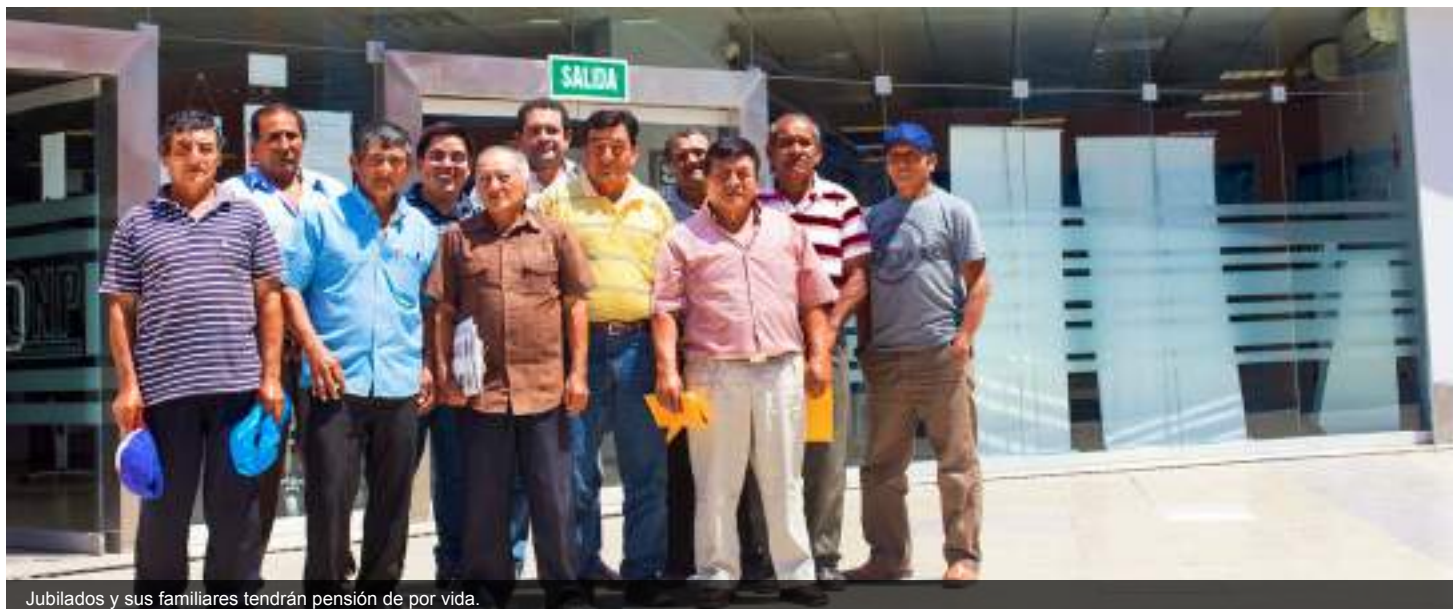
Jubilados y sus familiares tendrán pensión de por vida.

D espués de una larga batalla legal, el Tribunal Administrativo Previsional de la ONP decidió reconocer una pensión de por vida a los ex colaboradores de la empresa Cayaltí y a sus familiares a quienes también se les restablecerá la cobertura médica por tratarse de personas de la tercera edad.