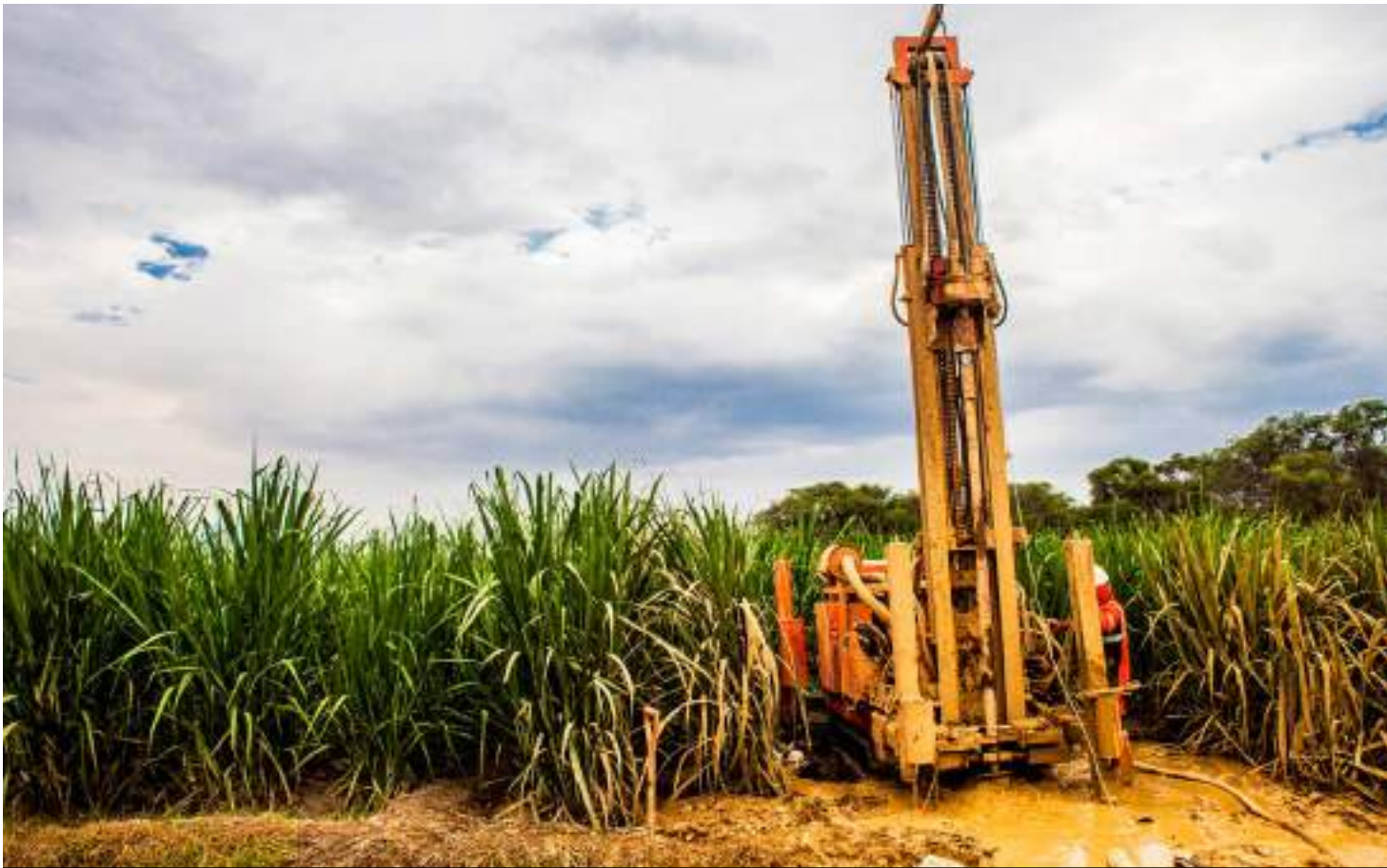
El agua es vital para la siembra de caña y asegurar una óptima cosecha.