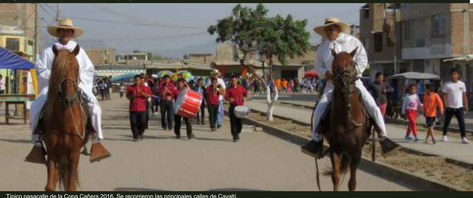
Típico pasacalle de la Copa Cañera 2016. Se recorrieron las principales calles de Cayaltí.