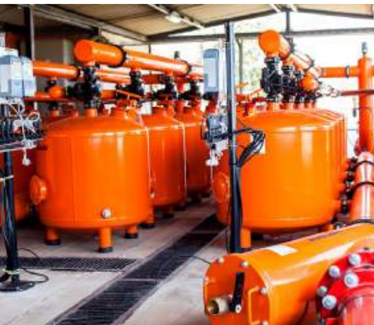
Filtros de grava. Parte del sistema de riego instalado en Cayaltí.