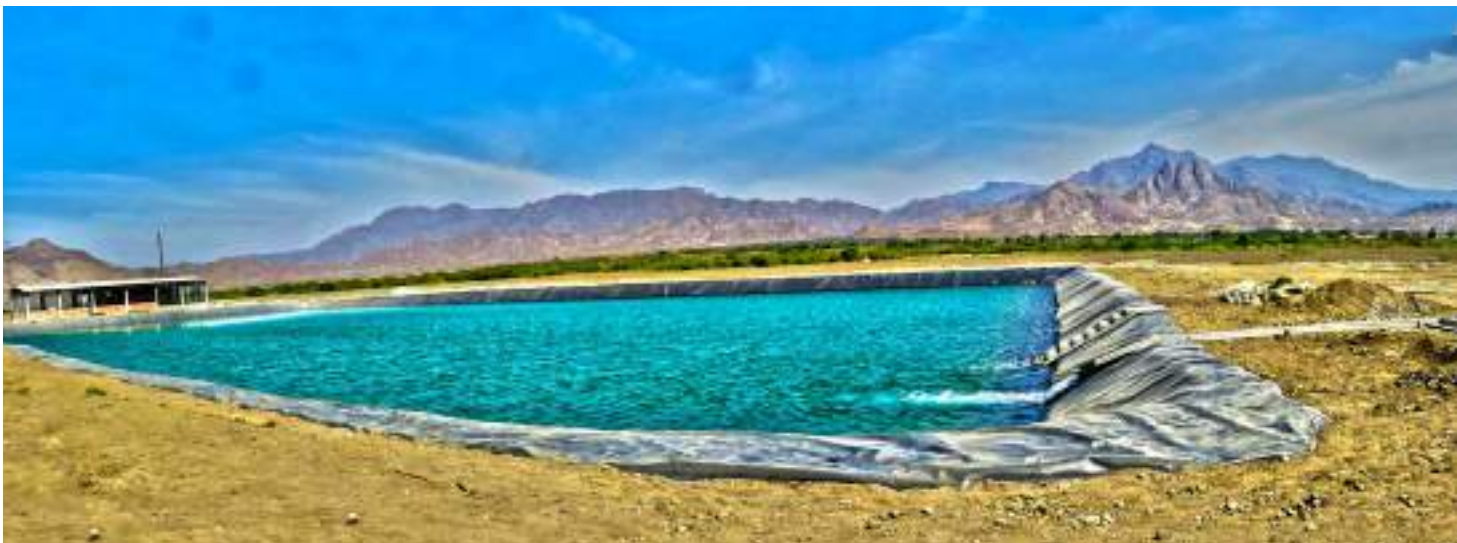
Reservorio El Triunfo, uno de los nuevos desarrollados por la empresa Cayaltí.

Aproximadamente el 80% de las inversiones es para acondicionamiento al riego por goteo.