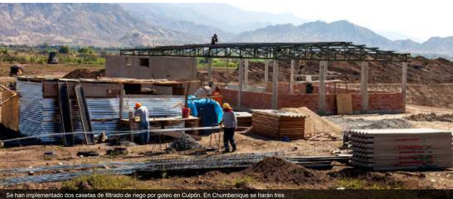
Se han implementado dos casetas de filtrado de riego por goteo en Culpón. En Chumbenique se harán tres.

Asimismo, durante el 2016 se invirtió en la instalación de un sistema de riego por goteo en los campos de La Viña (La Viña 1, La Viña 3 y La Viña 4), en Culpón (Dos Corrales, Lote 17, San Pedro, Roberto, Culpón, Santa Isabel y El Triunfo). Además en Chumbenique: Caña Cruz, Pancales, La Laguna, Santa Luzmila, Chumbenique 1, Chumbenique2 y Santa María Chumbenique.