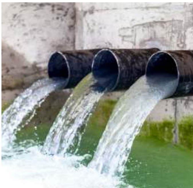
Desarrollamos un uso sostenible del agua.