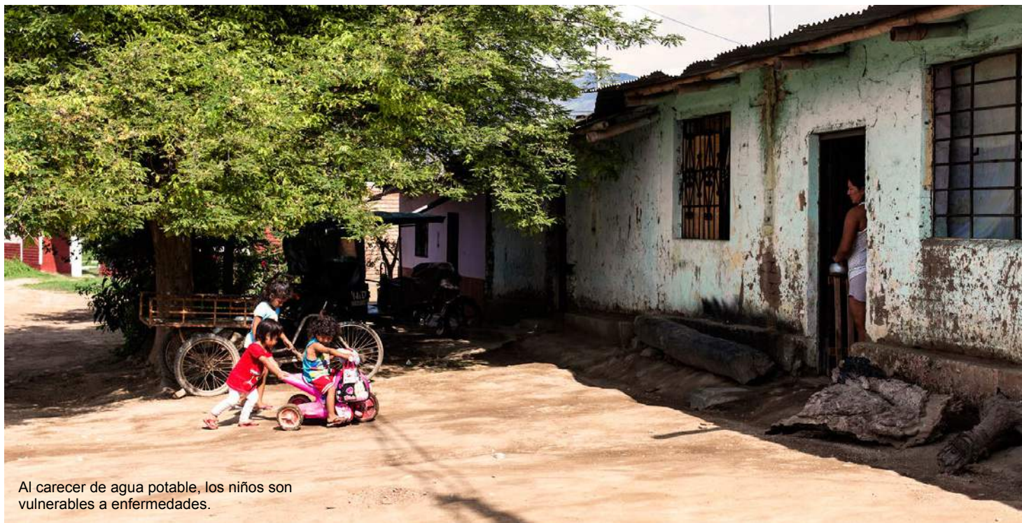
Al carecer de agua potable, los niños son vulnerables a enfermedades.

La extraordinaria belleza natural de Chumbenique contrasta con el abandono casi total de unos 300 habitantes del caserío, en quienes afloran sentimientos encontrados ya que afirman estar desamparados por la Municipalidad de Oyotún, distrito al que pertenecen.