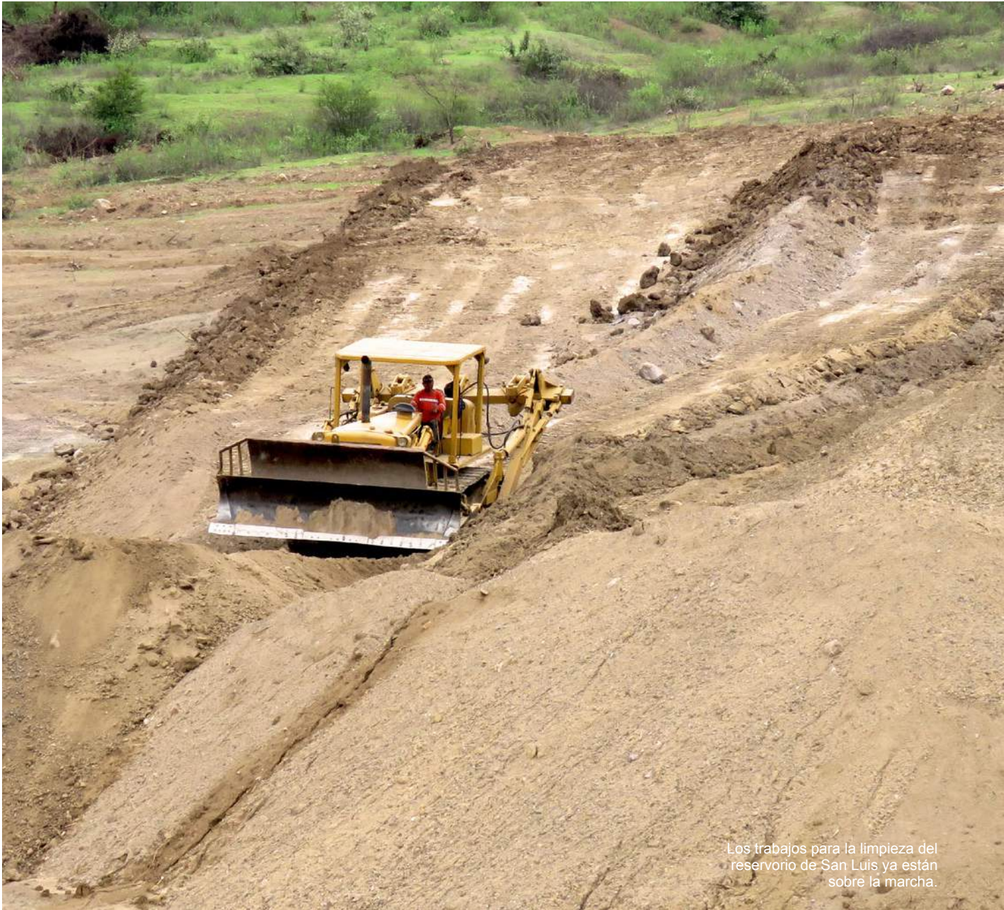
Los trabajos para la limpieza del reservorio de San Luis ya están sobre la marcha.