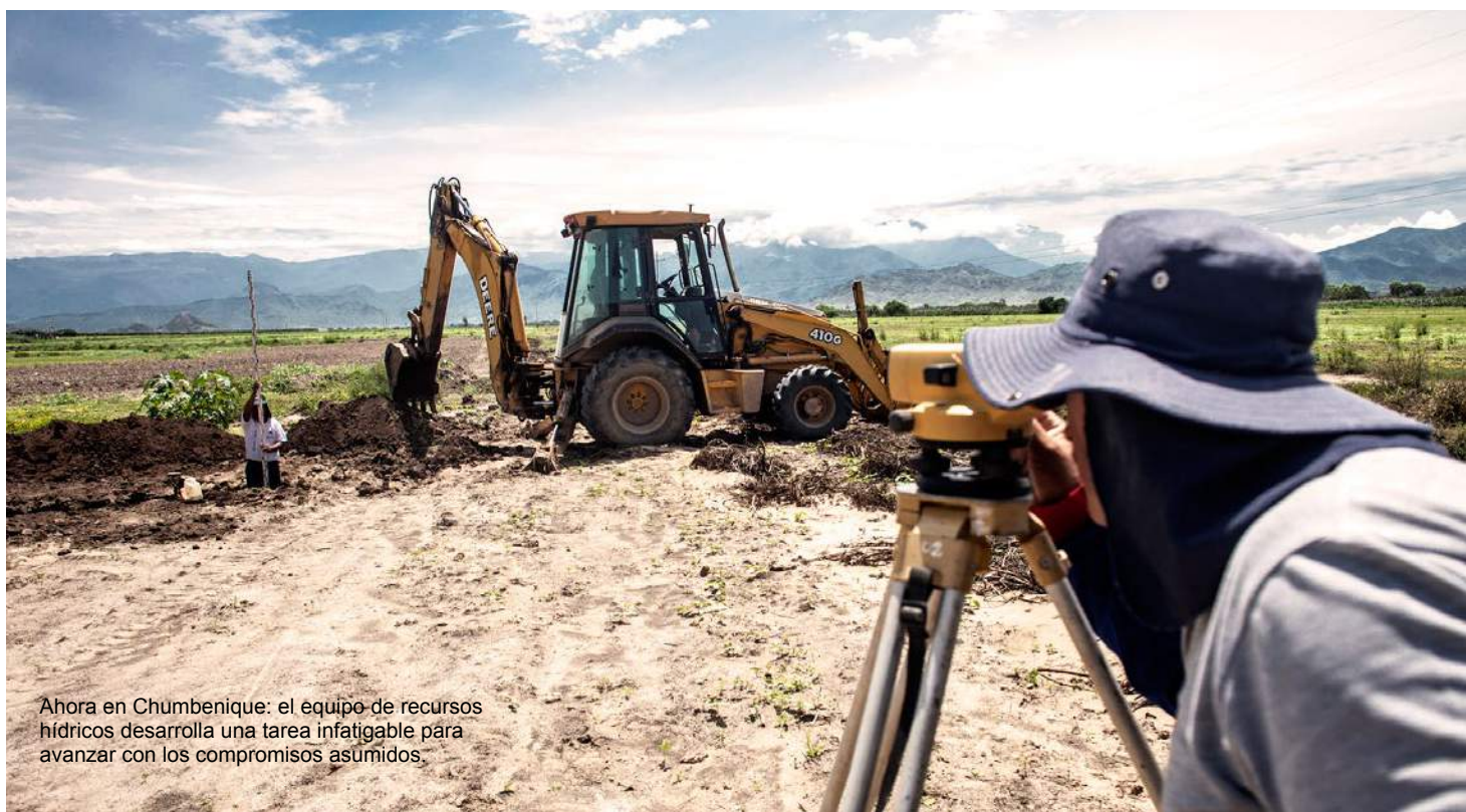
Ahora en Chumbenique: el equipo de recursos hídricos desarrolla una tarea infatigable para avanzar con los compromisos asumidos.