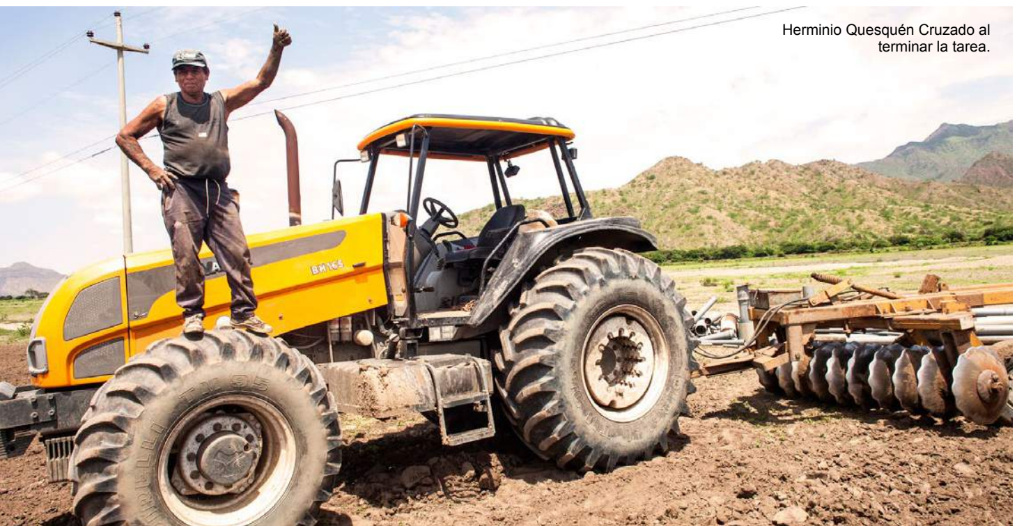
Herminio Quesquén Cruzado al terminar la tarea.

El canal integrador permitirá que las zonas bajas cuenten con agua para sus riegos oportunos.