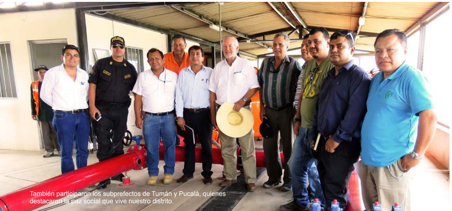
También participaron los subprefectos de Tumán y Pucalá, quienes destacaron la paz social que vive nuestro distrito.